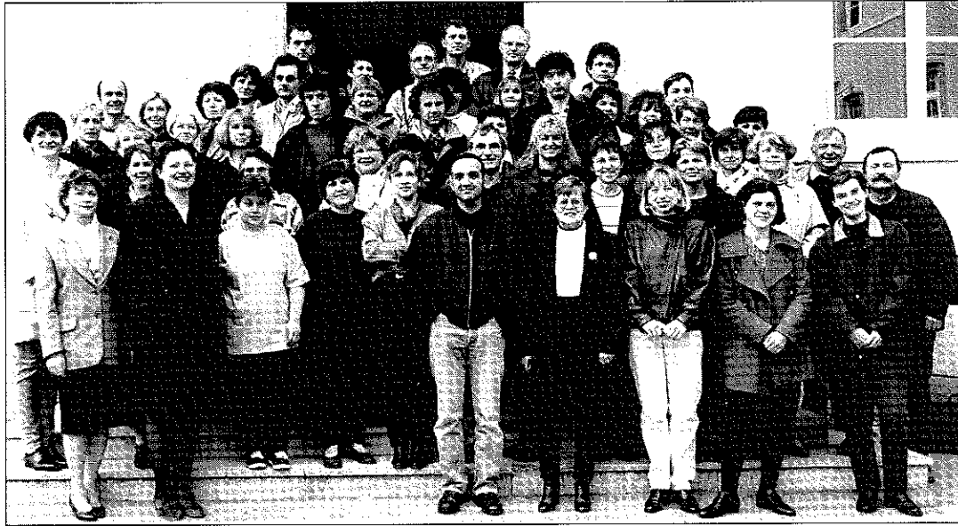
Le personnel du collège, en 1997.