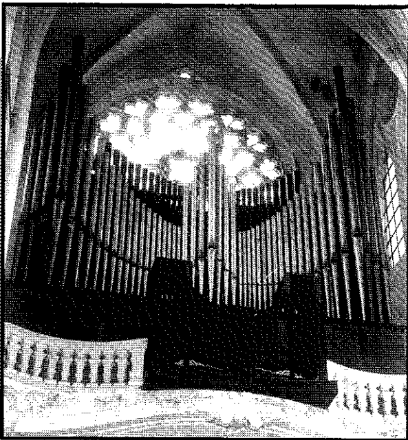
Vue d'ensemble de l'instrument

La troisième tranche des travaux de réfection des orgues de la cathédrale Saint-Etienne de Toul est en cours d'achèvement. L'instrument, qui compte parmi les plus importants de France, retrouvera bientôt ses qualités musicales d'origine.