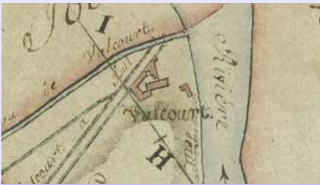
Le domaine de Valcourt, plan cadastral de Bicqueley, 1810.