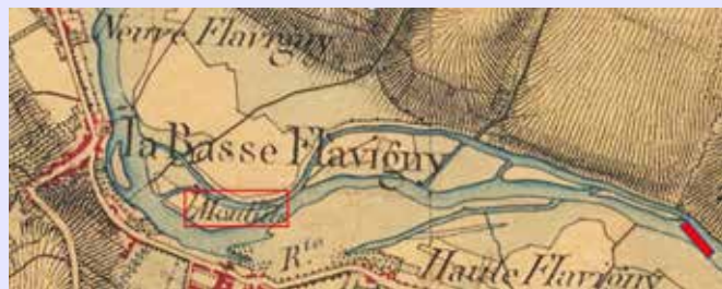
Flavigny : à droite, la digue du moulin, carte d'état-major, vers 1820