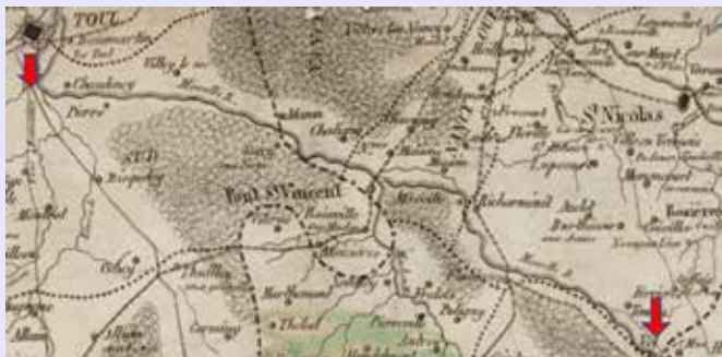
Parcours des bateaux de Valcourt à Vel(le), Géoportail.

de long pour 5,20 mètres de large et près d'1,30 m. de hauteur de bord. La seconde a pour dimensions 23 mètres de longueur et 4,55 mètres de largeur. La troisième est la plus petite et ne fait que 16,20 mètres de longueur (Bonfont, 1992). Seuls, les deux premiers bateaux sont chargés, le troisième reste normalement vide. Il n'est utilisé qu'en cas d'échouement d'un des deux autres : une partie de la cargaison lui est alors transférée à l'aide d'embarcations annexes (passe-cheval, grosse nacelle).