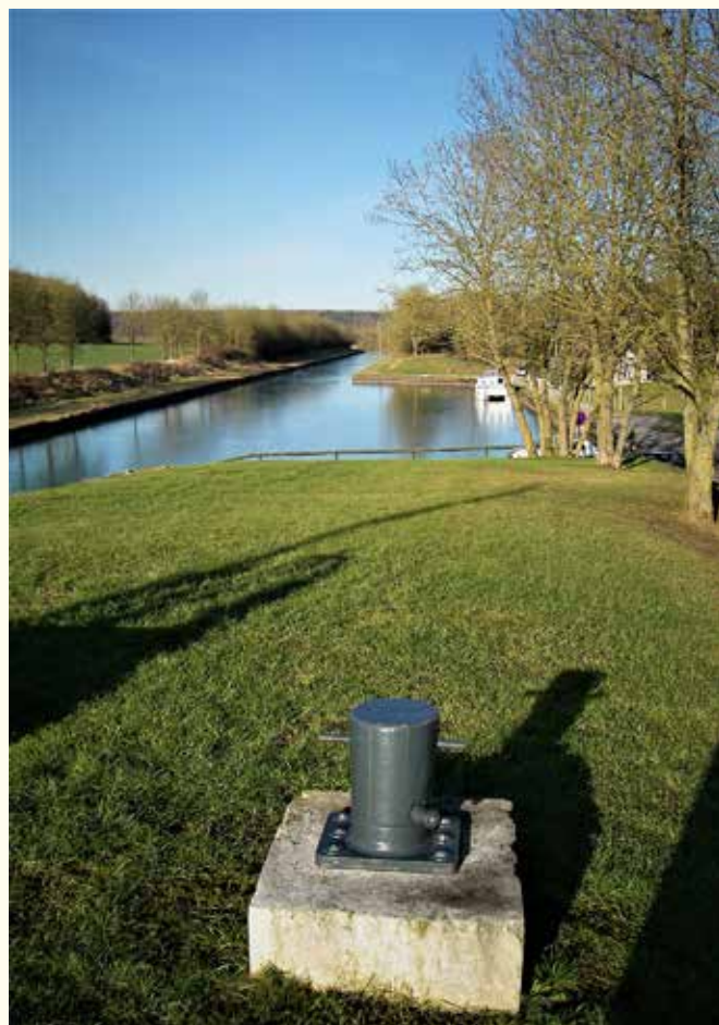
Le canal de la Marne au Rhin près de Lay-Saint-Rémy

Lay-Saint-Rémy avait atteint son apogée démographique en 1851. Son rôle de voie de passage fut renforcé par la Révolution des transports. La construction du canal de la Marne au Rhin (1839-1853) et, dans le même temps, celle du réseau ferré, signifièrent pour la poste aux chevaux une terrible concurrence qui entraîna rapidement sa ruine puis sa disparition. Mais la route nationale demeura l'axe principal du village. Le développement des nouveaux moyens de transport augmenta davantage le trafic routier, continuant de faire le bonheur des aubergistes et cafetiers. A cette époque, on ne parlait pas encore des nuisances de la route, on ne considérait que la chance que cela représentait pour le village. Avec le canal, Lay-Saint-Rémy devenait aussi un village-étape pour les mariniers. Vers 1900, six ménages de mariniers se faisaient même domicilier officiellement au village. Le passage des péniches faisait vivre alors cinq ménages d'épiciers ainsi que des « conducteurs de bateaux ou charretiers de marine » qui tiraient les péniches le long des berges. Tous ces travaux avaient eu une incidence sur les paysages et les sols. Il avait fallu notamment construire un tunnel pour le canal. Cela avait été catastrophique pour les sources alimentant le village. Plus aucune eau n'arrivait à l'égayoir et au lavoir public.