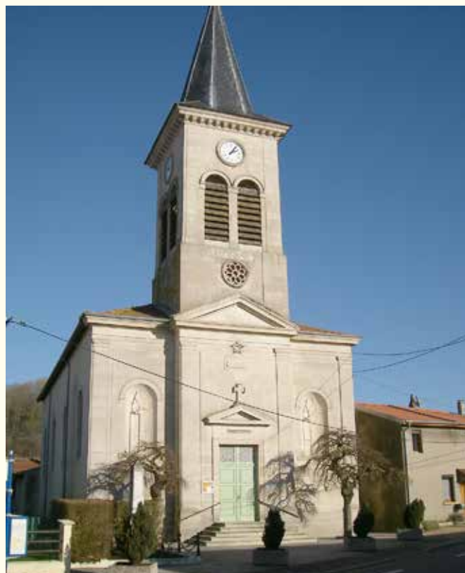
La nouvelle église reconstruite à partir de 1843

Le XVII e siècle avait laissé le village exsangue. En 1710 il n'y avait plus que vingt-huit habitants. Il y en avait dix fois plus en 1789. Au milieu du XIX e siècle Lay-Saint-Rémy comptait quatre-cent-quinze habitants et environ cent-trente ménages répartis en cent-douze maisons le long de trois rues 1 . Il y avait alors cent-quatre-vingt-deux hectares de forêts sur le finage du village. La population de Lay-Saint-Rémy vivait majoritairement de l'agriculture. Elle comptait de nombreux petits propriétaires dont quarante-huit vigneron cultivant une soixantaine d'hectares de vignes. La superficie de ces dernières avait progressé de moitié depuis la Révolution. Jardins et chènevières occupaient près de dix hectares. Il y avait quatre cultivateurs d'importance et tous les artisans-commerçants habituels des villages d'alors. Dans la première moitié du siècle, la population avait presque doublé. Cette croissance rapide avait eu diverses conséquences sur l'équipement du village.