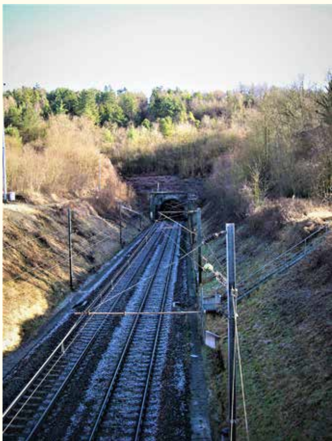
Le passage de la voie ferrée.

d'école avait un petit logement au premier étage à côté de la salle du conseil municipal. Les travaux avaient coûté plus de 6 900 F.