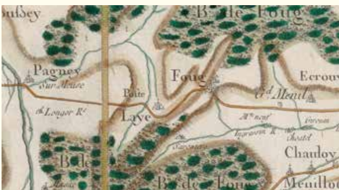
Cassini . Extrait de la carte de Cassini de Thury, f.111, 1759.

Lay-Saint-Rémy, non loin de Pagny-sur-Meuse, à neuf kilomètres de Toul, est un de ces villages qui jalonnent l'ancienne R.N.4 devenue D.400. Sa position sur le grand axe Paris-Strasbourg en fit très tôt un village d'étape. Cette commune rurale d'environ trois-cent cinquante habitants fait partie de la Communauté de Communes Terres Tuloises (CC2T). Le village est placé sur le flanc du Val de l'Âne, cette vallée morte témoin de la capture, il y a bien longtemps, de la Haute-Moselle par un affluent de la Meurthe. L'emplacement, entre Meuse et Moselle, est idéal. Il contrôle une voie de passage importante située dans un rentrant des Côtes de Meuse. De nos jours encore, cette voie est empruntée à la fois par les routes, le canal et la voie ferrée.