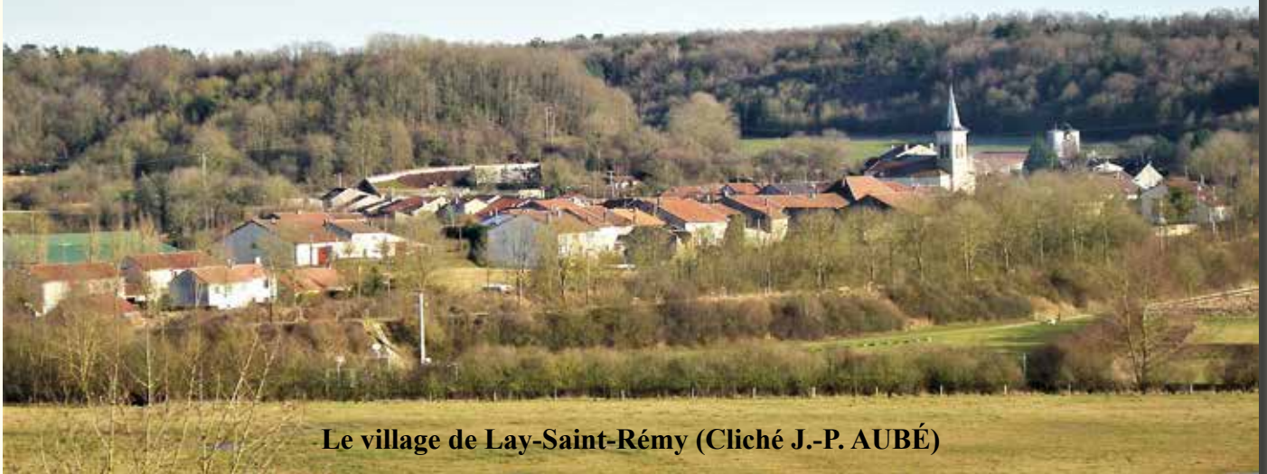
Le village de Lay-Saint-Rémy

Lay-Saint-Rémy, non loin de Pagny-sur-Meuse, à neuf kilomètres de Toul, est un de ces villages qui jalonnent l'ancienne R.N.4 devenue D.400. Sa position sur le grand axe Paris-Strasbourg en fit très tôt un village d'étape. Cette commune rurale d'environ trois-cent cinquante habitants fait partie de la Communauté de Communes Terres Tuloises (CC2T). Le village est placé sur le flanc du Val de l'Âne, cette vallée morte témoin de la capture, il y a bien longtemps, de la Haute-Moselle par un affluent de la Meurthe. L'emplacement, entre Meuse et Moselle, est idéal. Il contrôle une voie de passage importante située dans un rentrant des Côtes de Meuse. De nos jours encore, cette voie est empruntée à la fois par les routes, le canal et la voie ferrée.