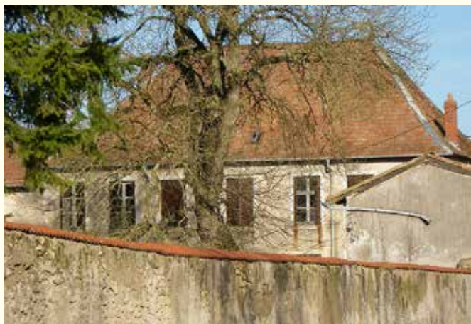
L'ancienne poste aux chevaux côté cour (Cliché J.-P. AUBÉ, 2008)

une localité située à la limite de deux départements. Il est significatif qu'au XVIII e siècle, Lay-Saint-Rémy partageait encore une soixantaine d'hectares de forêts en indivision avec Pagny-sur-Meuse son voisin. Depuis la Révolution Lay-Saint-Rémy, voisine immédiate du département de la Meuse, est une entrée et sortie des limites administratives du département de la Meurthe. C'est par exemple là qu'en 1824 le nouvel évêque de Nancy, Monseigneur de Forbin-Janson, était venu solennellement prendre possession de son diocèse, accueilli par la population et par trois chanoines de Nancy « venus lui mettre la crosse en main ». Avant 1789 le même cérémonial pour les nouveaux évêques de Toul se déroulait un peu plus loin à Void, dans l'actuelle Meuse.