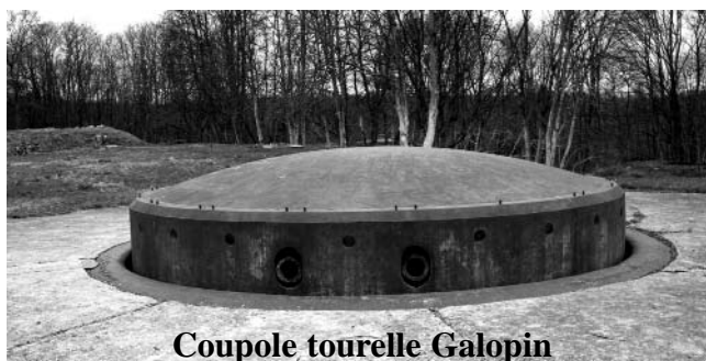
Coupole tourelle Galopin