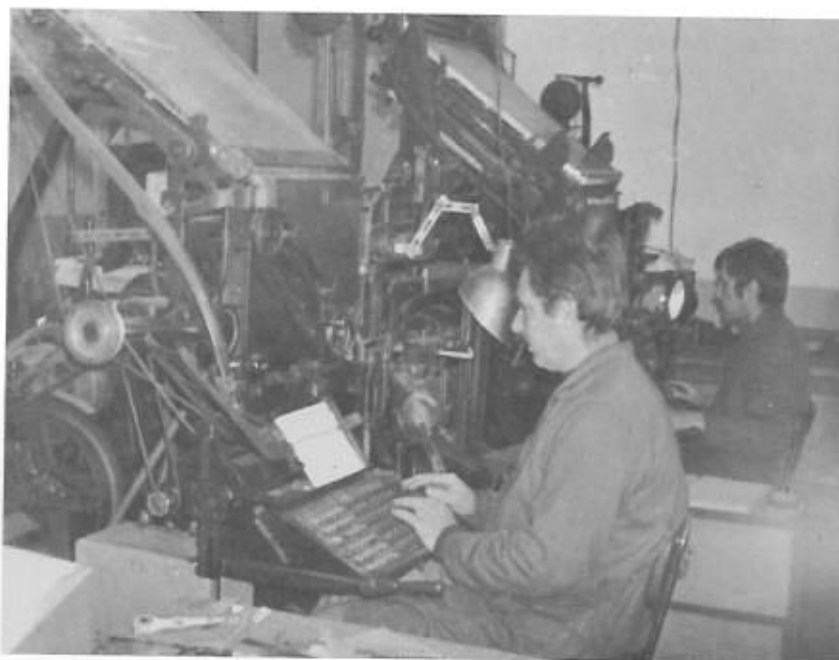
Deux machines de composition mécanique.

Le département offset permet également des travaux très diversifiés, allant des étiquettes diverses aux impressions en couleurs, affiches et autres imprimés que ce genre de machine rend plus appropriés.