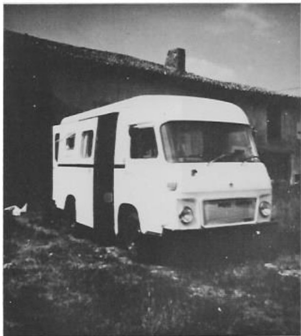
Exemple d'un aménagement.

Dès que sont ouvertes les parties réservées aux lanterneaux et baies diverses, la carrosserie est isolée à la laine de verre. Puis, sur un contre-plaqué bloquant celle-ci, est mis en place le revêtement final (mousse vinylique, formica, tissu...). Les meubles sont fabriqués sur mesure et installés (lits, coffres, armoire, plan de cuisson, réfrigérateur, cabinet de toilette...). Enfin le véhicule est peint extérieurement après ponçage.