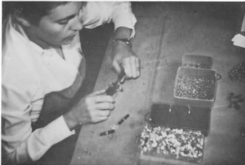
Création de modèles par emmaillage.