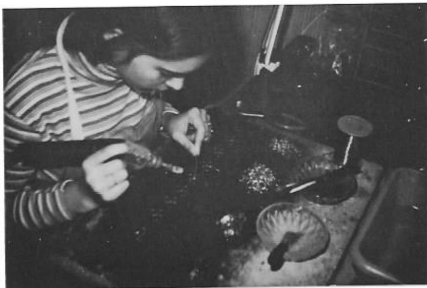
Assemblage de colliers par soudage.

Chaque année, cette maison accueille des groupes, et des membres d'associations diverses. Toutes les associations intéressées sont invitées cordialement (uniquement sur rendez-vous en téléphonant au (83) 43.87.25).