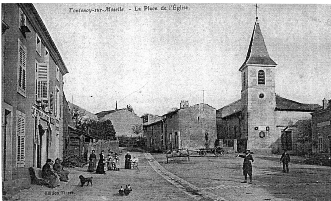
La place de l'église vers 1903. On remarque, jouxtant l'église, une rangée de maisons démolies au cours de la dernière décennie, permettant ainsi le désenclavement de l'édifice et l'accès direct au cimetière.