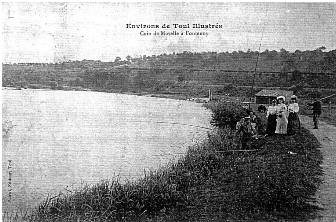
Les élégantes au bord de l'eau vers 1910. On remarque, derrière elles, un petit bâtiment avec un toit à une pente. Il s'agit du lavoir communal dont il reste quelques vestiges.