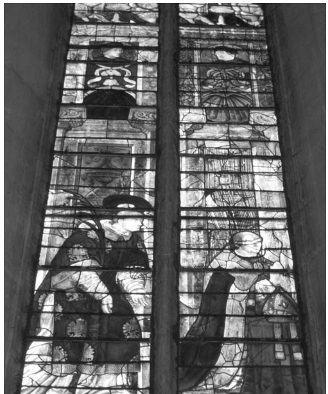
Eglise Saint Médard de Blénod-lès-Toul, verrière de Hugues des Hazards (abside)

Passons maintenant à la figuration même de Hugues des Hazards dans la baie faisant face à sa famille, au nord-est de l'abside. L'évêque est tourné du côté de la verrière axiale de l'église. Habillé d'une aube, d'une tunique et d'une chape attachée par un fermail d'orfèvrerie, le prestigieux et pieux donateur est agenouillé sur un