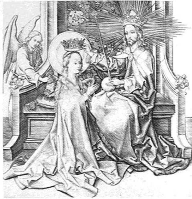
Dieu couronnant la Vierge, gravure de Martin Schongauer (1485)