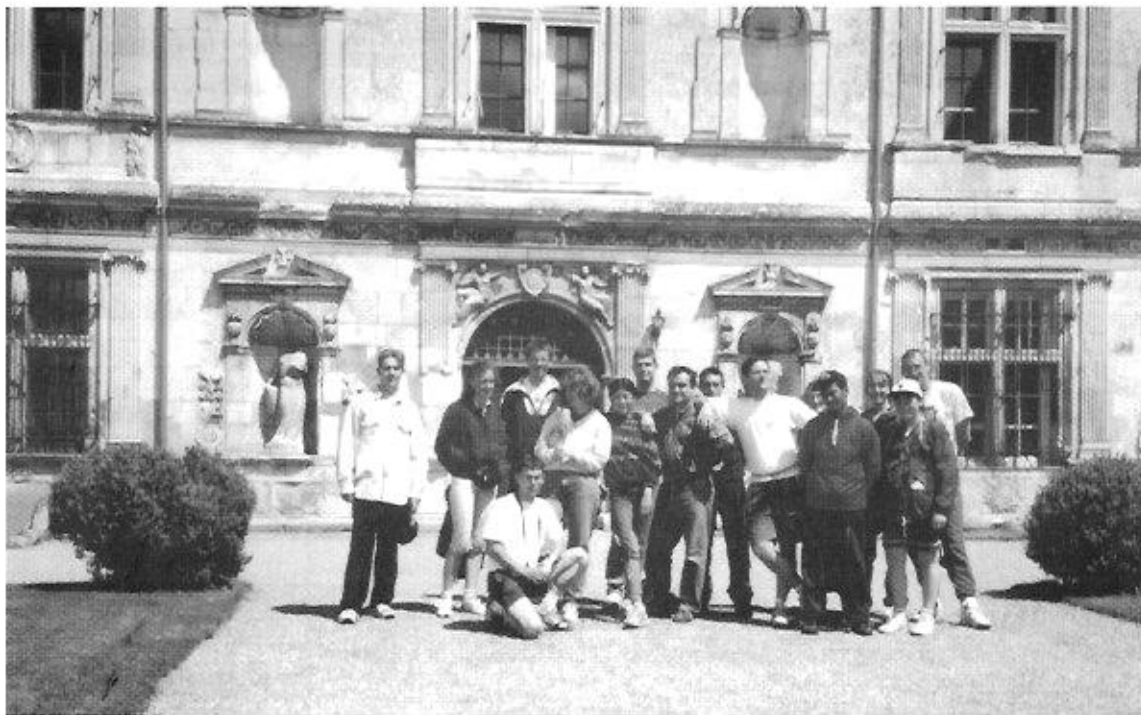
Les "Jeunes Amis du Musée de Toul", au château de Montbras.