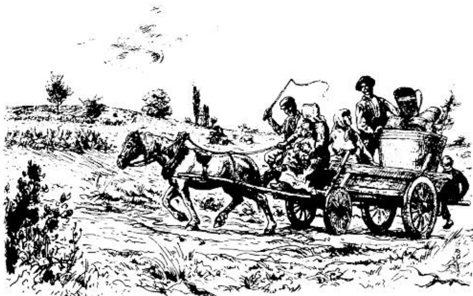
COLIN Paul-Emile, La vendange , eau-forte.

Petits chevaux lorrains, comme il est possible d'en voir de nombreux exemplaires peints par les artistes locaux..