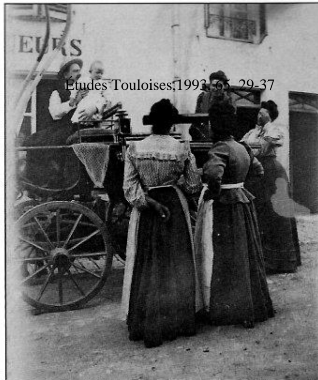
Études Toulouises, 1993, 65, 29-37

encore un et le jouer, ma grand-mère qui voyait tout m'a dit "Ca suffit, reste ici, tu es trop bête de te faire prendre tes oeufs d'une pareille façon". J'étais très mortifiée.