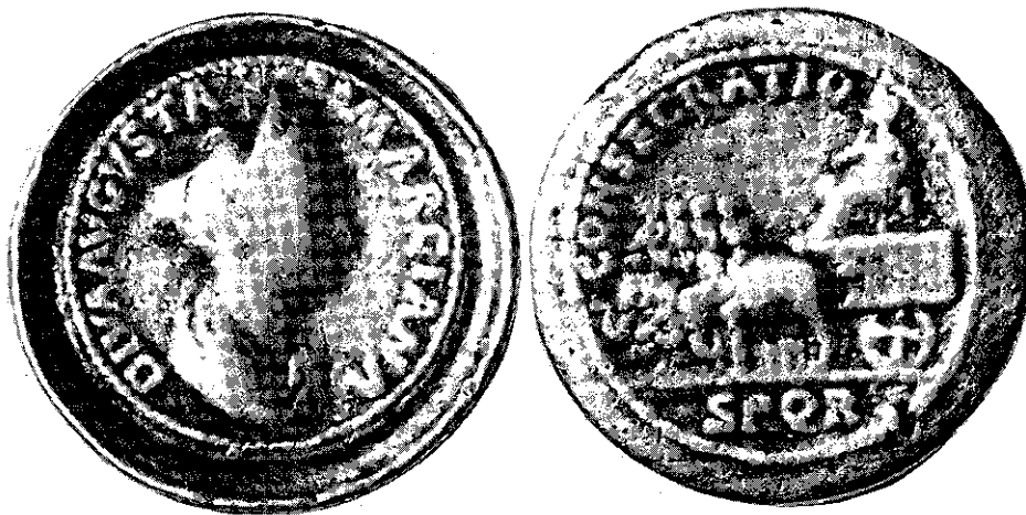
Médaille contorniate (Toul)