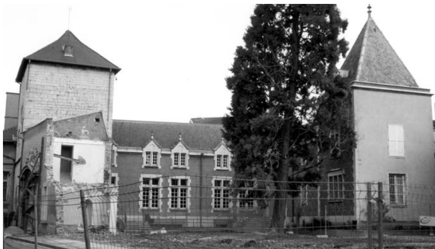
Les travaux de rénovation de la rue Général Foy ont permis de dégager, pour quelques semaines, l'Hôtel dit "du Gouverneur".