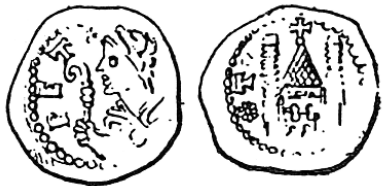
Monnaies frappées à Toul...